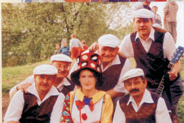
tekst i opracowanie: Jarek Świerkot